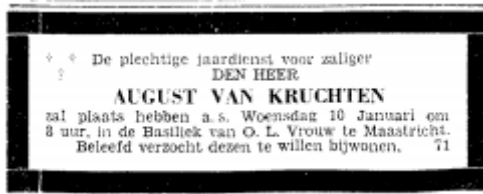
Uit: Limburger Koerier, maandag 08-01-1940.