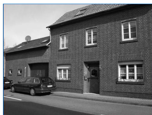
Het ouderlijk huis te Kreutzrath