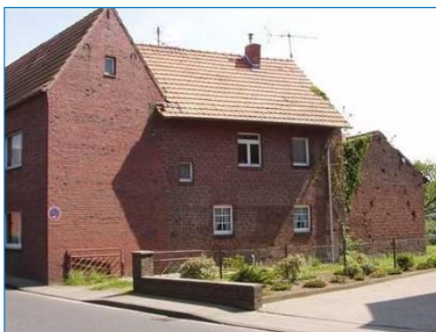
Hij leert te Schierwaldenrath het molenaarsvak