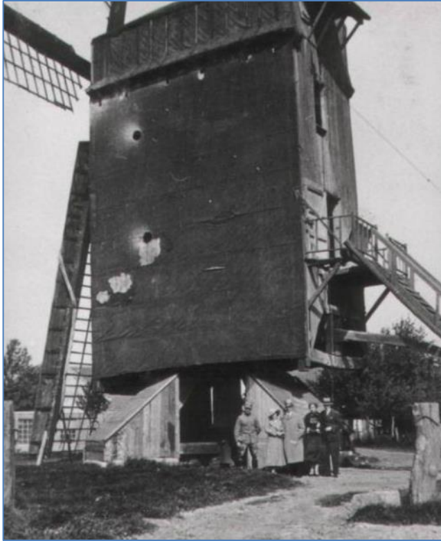
Onbekende mensen bij de molen.